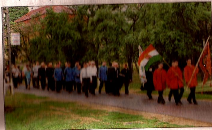
Az ünnepi menet végigvonult Micske főutcáján július 26-án, vasárnap